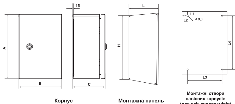
Монтажні отвори навісних корпусів (для всіх типорозмірів)